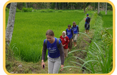
MARCHE EN RIZIÈRE