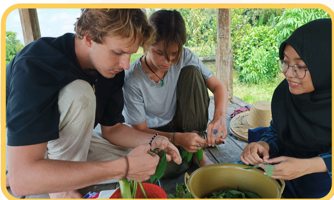
COURS DE CUISINE